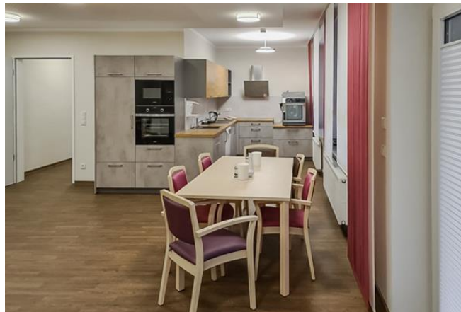
unsere offene Küche

Für alle Neugierigen oder auch Unentschlossenen besteht die Möglichkeit eines kostenfreien Schnuppertages. Hier können Sie sich ganz in Ruhe einen ersten Überblick über die Räumlichkeiten und die Angebote unserer Einrichtung machen. Fragen zu Formalitäten beantworten wir gerne.